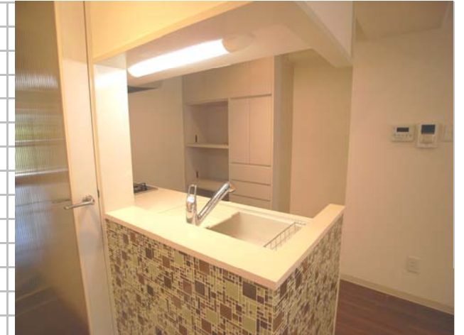
③キッチンの腰壁にはアクセントとしてガラスモザイクタイルを仕様しています。