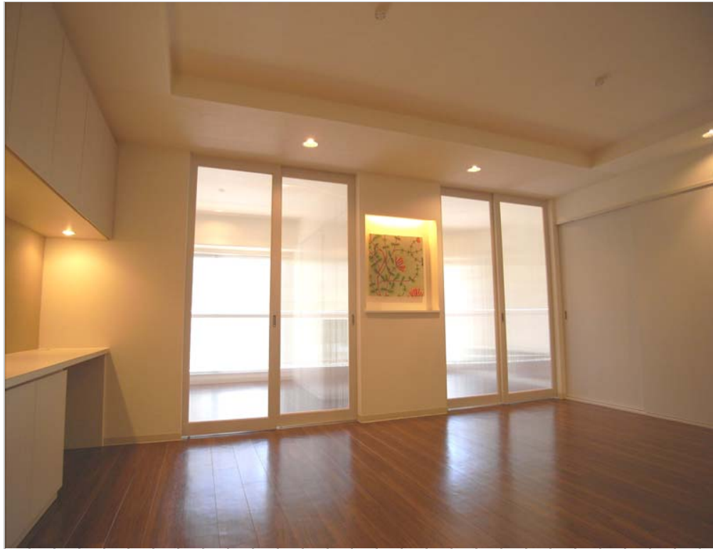
①暗くなりがちで、中リビングを半透明の引き込み戸によって採光を確保しました。正面には、季節感が味わえる様なディスプレイができるニッチカウンターを設けています。