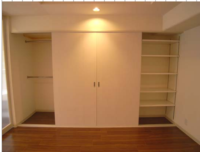
⑤リビングあるクローゼットは、4枚の引戸を開けると季節物の衣類や生活小物などが収納できるようになっています。