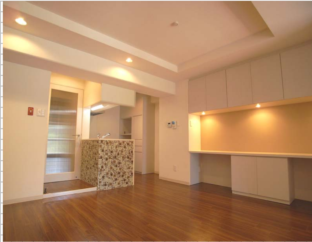
②閉鎖的なキッチン半オープン型にして、リビングと一体になるよう開放感をだしました。カウンター収納を造り付け、パソコンやプチエスコーナーとして利用できるようにしています。