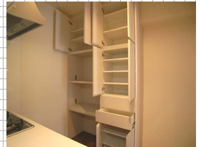
④お施主様オーダーのキッチン収納を造り付けました。