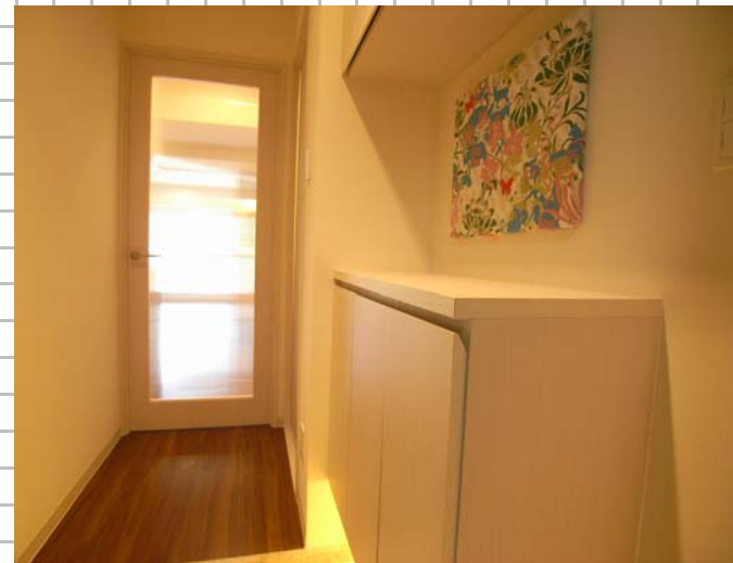
⑥ブーツやヒールなどの高さや容量に考慮した下足箱を造り、リビングからの明るい光が入るような玄関にしました。

◆200万円内で実施した内容とポイント 女性のお施主様でしたので、収納の容量やサイズに考慮しました。無駄に収納を造らず、常に整理整頓が心がけられるようにしています。お施主様が望む、シンプルライフを楽しめる空間設計にしまし